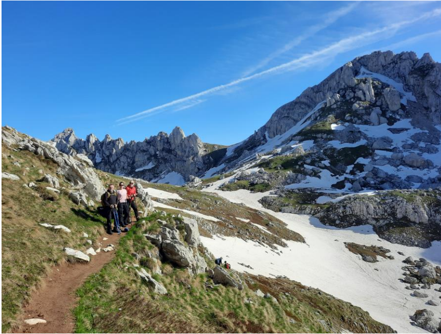
Зупци и Бандијерна

Дурмитор је предивна црногорска планина на којој постоји предиван свет фантастичних врхова, долина и језера. Оштри врхови и гребени чине га идеалним за планинарење. Дурмитор има чак 48 врхова преко 2000 метара а 7 преко 2400 метара. На Дурмитору се налази 17 језера, познатих као "горске очи".