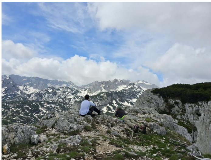
На врху Црвене греде