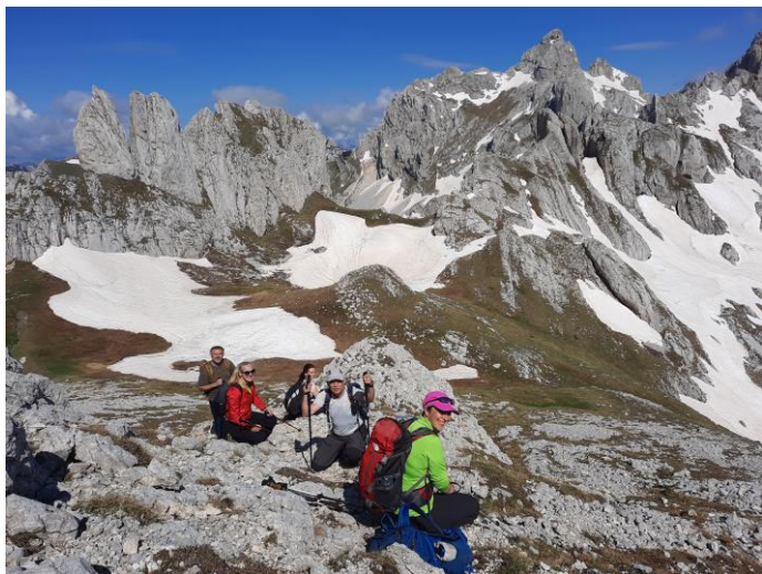
Успон на Бандијерну

успон на тројни превој 2200 м где је следећа пауза испод самих Зубаца, са погледом на Локвице, Боботов кук и Вјетрена брда. После тројног превоја следи завршни успон на врх Бандијерна 2409 метара, шести врх по висини на Дурмитору. Бандијерна се налази у срцу Дурмитора са које се виде сви остали врхови. Висинска разлика износи 500 м. Ноћење.