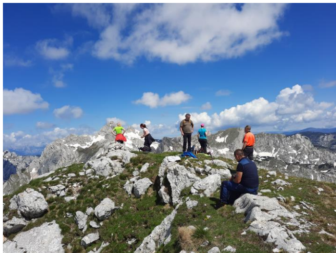
На врху Бандијерне