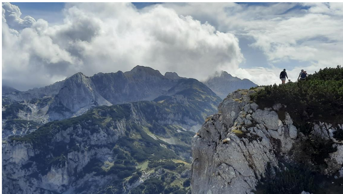
На Црвеној грди

Полазак из смештаја у 8 часова. Одлазак минибусом до Момчиловог града 1750 м, одакле креће успон на Црвену греду 2175 метара. Терен на успону је каменит, кривудава и пробија се кроз бор кривуљ или планински бор. Са Црвене грде се одлично виде Црно, Јаблан, Змиње и Барно језеро као и већина дурмиторских врхова. У повратку са врха направићемо паузу на Јаблан језеру. Висинска разлика 450 метара. Ноћење.