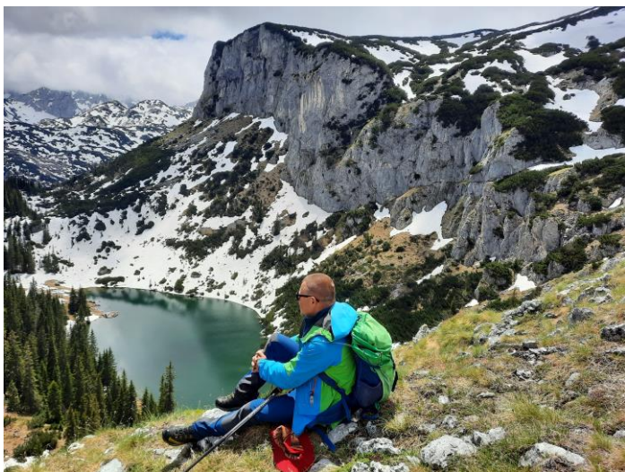
Јаблан језеро и Црвена греда